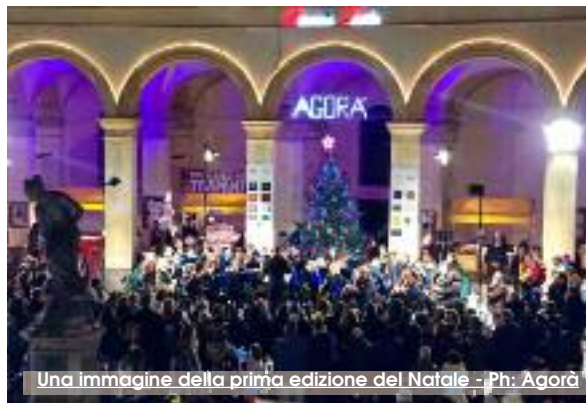
Una immagine della prima edizione del Natale

Cresce a Trapani la magia del Natale. Ritorna, infatti, per la terza edizione + "Natale a' Chiazza". Da stasera, fino a domenica 23 dicembre, la Piazza ex Mercato del Pesce si animerà di luci, gioia e musica per le festività natalizie. Il merito va all'Associazione Politico Culturale Agorà che invita i trapanesi alla manifestazione volta a ricreare nel centro storico della città il clima natalizio del quale tutti sentiamo l'esigenza. Agorà ha deciso di proporsi come parte attiva delle iniziative natalizie. In piazza sarà allestito un mercatino di Natale composto da artigiani e commercianti di generi alimentari, dove sarà possibile degustare i prodotti tipici della nostra terra e bere i vini locali. Hobbisti, bande musicali, esibizioni di scuole di danza, concerti di gruppi musi-